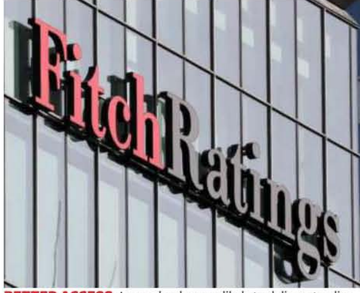
BETTER ACCESS. Larger lenders are likely to deliver steadier performances due to their more established lending operations

ECONOMIC SLOWDOWN Nonetheless, Fitch Ratings does not expect an extended